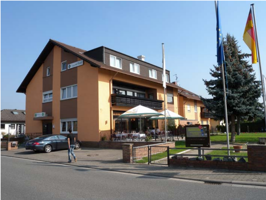
Brandschutztechnisches Gesamtkonzept für ein bestehendes Gebäude Bearbeitung 2010