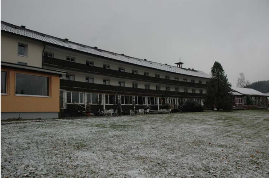
Brandschutztechnisches Gesamtkonzept für ein bestehendes Gebäude Bearbeitung 2005